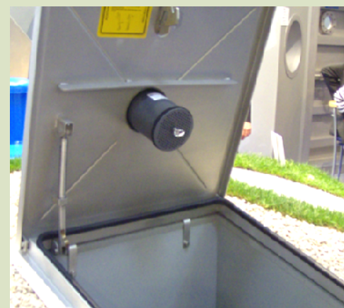
Rohrbiofilterpatrone in Abdeckung eingesetzt