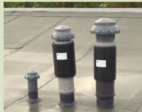
Rohrfilter zum Aufstecken