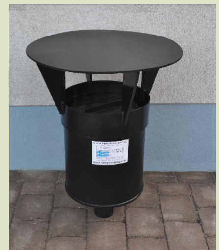
Aufsatzfilter mit Haube